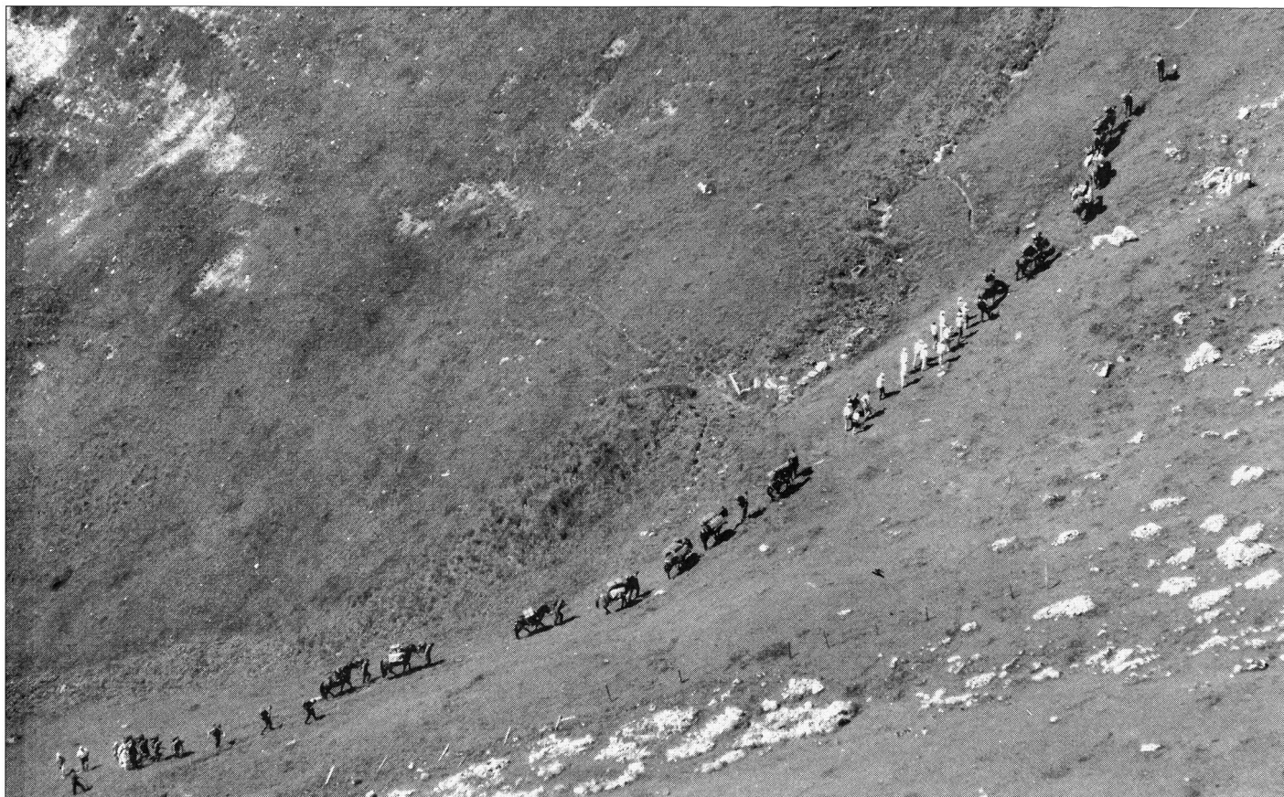
Die Säumerkolonne im Aufstieg zum Kinzig-Pass.