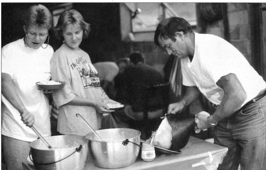
Die Liebe zum Trekking geht auch durch den Magen: Nie war Schmalhans Küchenmeister. Bei Suworow dürfte das anderes gewesen sein.

schöne Wanderung über den Panixer mit den malerischen Ausblicken ins Bündnerland, der wunderschöne Lagerplatz am Ufer des Vorderrheins mit der sprudelnden Quelle, der grottenartigen Einbuchtung am Ufer des Flusses, von wo es über Moosbehänge in ein Naturbecken tropft mit klarem, eiskaltem, grünlichem Wasser, in welches man morgens rasch eintaucht, das Spiel von Licht und Schatten, die Fahrt mit dem Pinz durch unwegsames Gelände, die Euphorie beim Riverrafting auf dem Vorderrhein... Erinnerungsfetzen, welche auftauchen und wieder versinken.