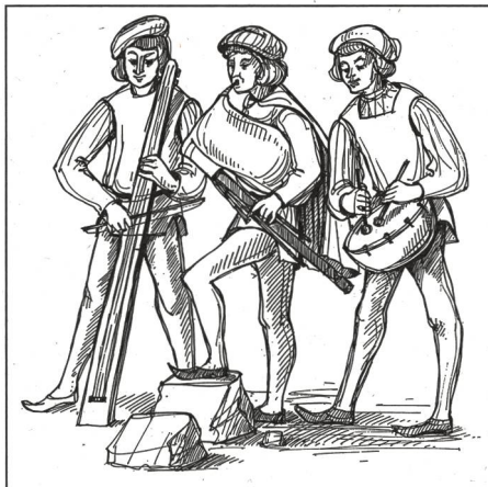
Spielleute waren an höfischen Festen gern gesehene Gäste.

punkt gestellt. Versuche, das griechische Theater zu neuem Leben zu erwecken, führten um 1600 zur Oper, die bis heute ein wichtiger Musikzweig geblieben ist.