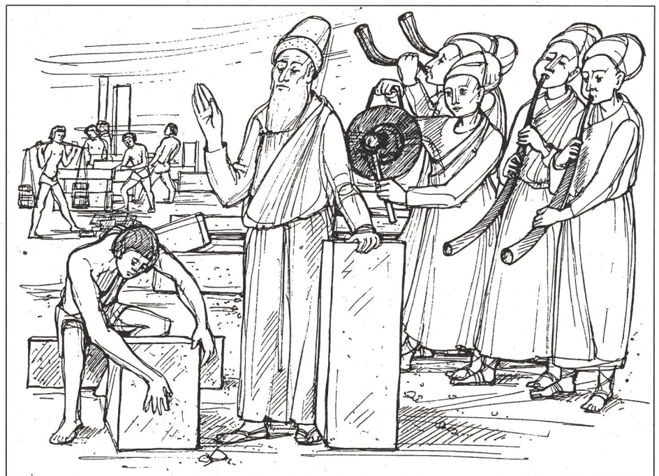
Tempelbau mit Musik.

Die Entwicklung der Technik hat es mit sich gebracht, dass auch die Musik von revolutionären neuen Möglichkeiten umgestaltet worden ist. Einst das Vorrecht einer bevorzugten Minderheit ist sie heute Allgemeingut und sogar ein bedeutender Faktor im Wirtschaftsleben geworden. Wo wir stehen und gehen, tönt sie uns entgegen. Nicht verwunderlich, dass immer mehr Leute die Musik als etwas Gewöhnliches ansehen, gut genug, die arbeitsfreie Zeit mit etwas Stimmung zu verschönern und uns durch sie wie eine Droge aufmuntern zu lassen, wenn wir müde sind. Wir wollen den Musikbetrieb etwas durchleuchten und Fragen stellen: Wie war das früher? Welche Aufgaben hat Musik? Welche Erscheinungsbereiche gibt es? Wie wird Musik eingesetzt? Das Thema soll in 8 Folgen abgehandelt werden.