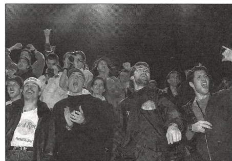
Erregungszustände durch Musik.

Musik begleitet uns tagein, tagaus, ob wir es wollen oder nicht. Wir befinden uns unter einer permanenten akustischen Berieselung. Der Radiowecker eröffnet den Tag. Musik ertönt beim Rasieren und Frühstück; Musik unterbricht die Morgenmagazine am Radio, erklingt immer dann, wenn der Sprecher gerade nichts mehr zu sagen hat. Auch auf dem Weg zur Arbeit, im Auto ertönt wieder Musik. Dazu umdröhnt uns der Lärm im Strassenverkehr, dieses ständige Rauschen, Hupen, Heulen, das Tosen der Stadt. Alles lärmt.