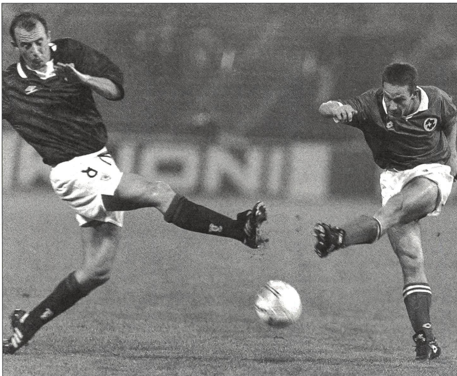
Tornähe: Zone knisternder Netzspannung.

«...Hast noch der Söhne ja!», hoffte die ältere Generation früher anlässlich ihrer nationalen Feierstunden. Dessen darf Fussballhelvetien nun, nach Jahrzehnten nagenden Zweifels, wieder gewiss sein. Und wer könnte die gelungene Wachtablösung der Generationen überzeugender signalisieren als der junge Held Stéphane Chapuisat, leiblicher Sohn des legendären Gabet Chapuisat. Jenen bewunderte ich zu seiner Zeit ebenfalls als nationalen Fussballhelden. Jetzt ist er also zusätzlich Helden-Vater. Die Idealvorstellungen drängen sich unwiderstehlich auf: Wie der kleine Stéphane den Vater bewunderte, ihm nachempfand, von jenem in harter Schulung gefordert und gefördert wurde, am väterlichen Sparringpartner emporwuchs, bis er diesen schliesslich sogar übertraf, um dessen Sache dann um so besser weiterzuführen. Die Bilder sind eigentlich zu schön, um wahr zu sein. Aber meine Phantasie besteht darauf. Sie labt sich im Idealfall, auch wenn der einen welschen Namen trägt. In mir regt sich ein grosszügig verallgemeinerter helvetischer Vaterstolz: Dass «wir» es nun doch fertig gebracht haben, einen so kompetitiven Nachwuchs auf die Beine zu stellen! Ver-söhnung also über Generationen- und Röstigraben hinweg, weil der Ball richtig rollt? Heil dir, Helvetia. ■