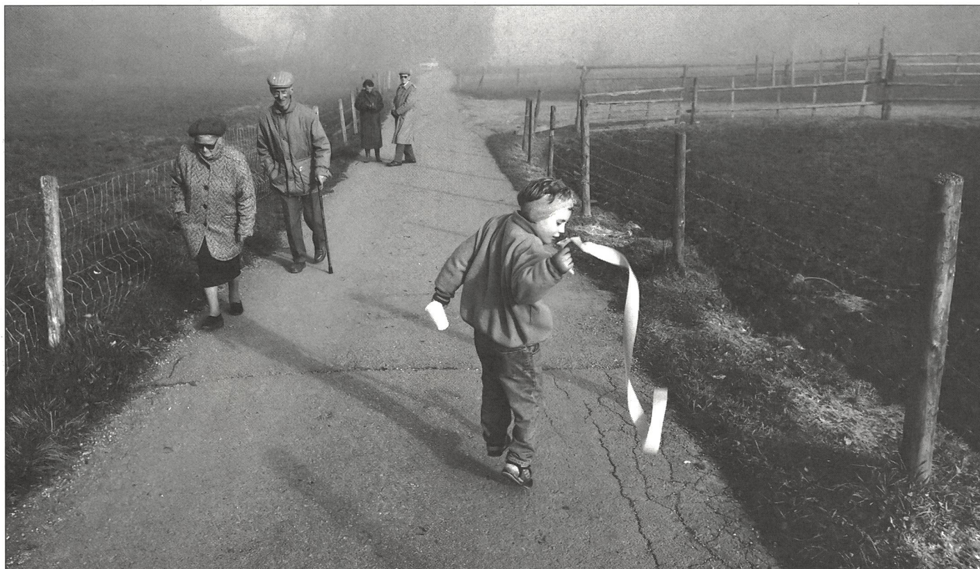
Jugendliche – ein «Noch-Nicht».

Wir brauchen emotionale Betroffenheit. Gefühle zeigen dürfen, soll selbstverständlich sein, soll der Ehrlichkeit und