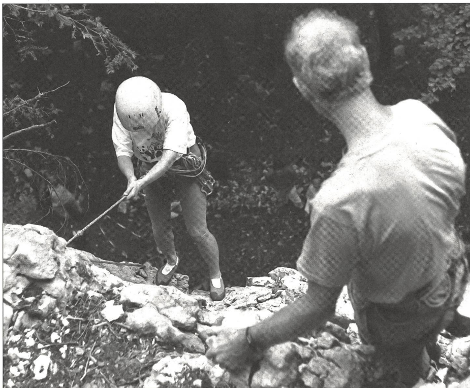
Leitende sind pädagogische Verantwortung zu tragen bereit.