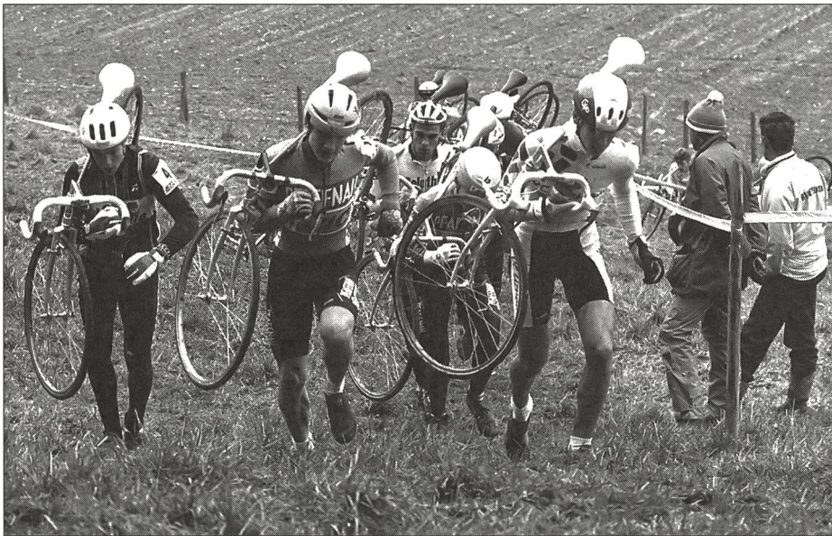
CoQ 10 führte bei einer Gruppe Radfahrern zu keiner Leistungsverbesserung.

Da diese Faktoren für Gesundheit und Ausdauerleistungsvermögen von Athleten eine grosse Rolle spielen, wurde schon früh angenommen, dass CoQ 10 eine wirksame Nahrungsergänzung für