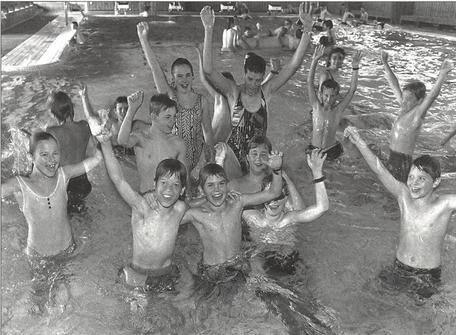
Freude und Spass im nassen Element stehen im Vordergrund.

Sowohl im Sportunterricht in der Schule als auch in der Freizeit wird das Kind immer wieder schnell an seine Belastungsgrenzen herankommen und mit Atemnot reagieren. Dies löst Angst-