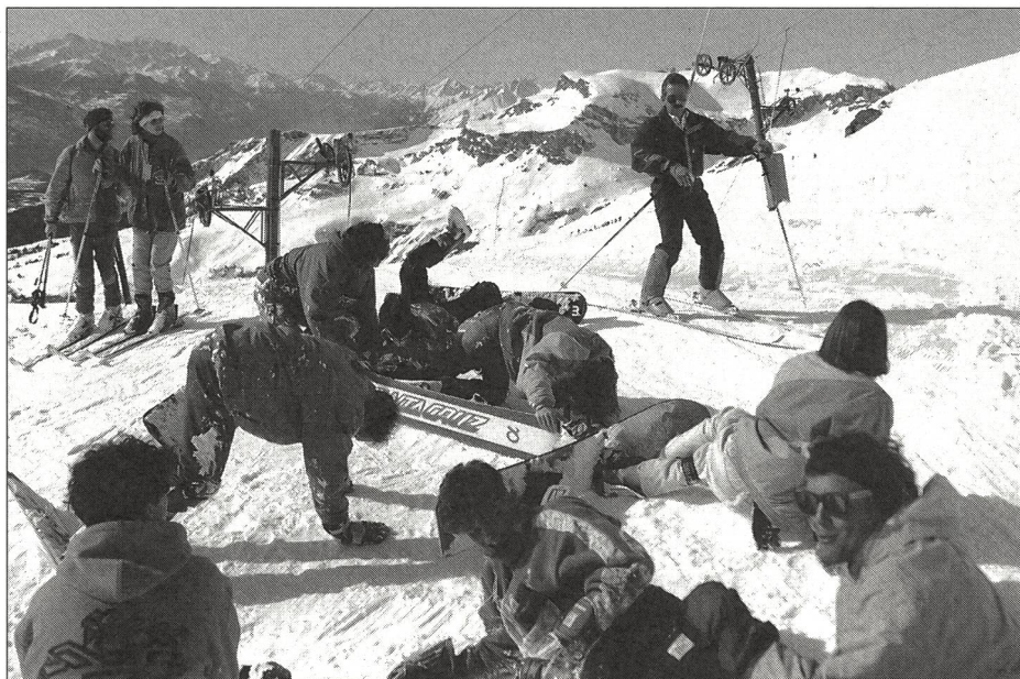
Bereits das Liftfahren ist ein Gefahrenherd.

Das Snowboarden scheint eine weitverbreitete Gleitsportart zu werden. Einige Kinder beginnen gleich mit dem Snow-