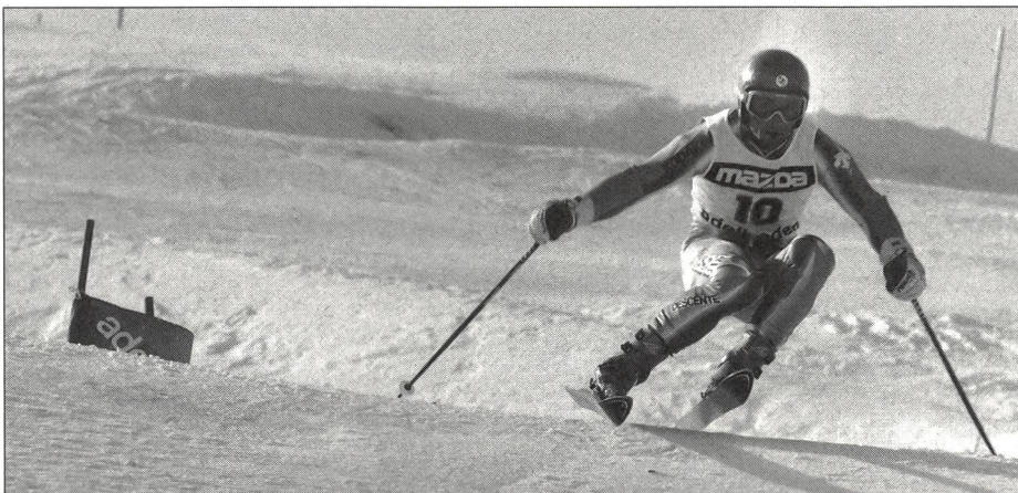
Richtiges Timing – Schlüssel zum Erfolg.

Ungleiches Können erfordert unterschiedliche Instruktionen, samt unterschiedlichen Informationen. In diesem Sinne müssen wir uns mit unseren Hinweisen und Anleitungen den Gegebenheiten anpassen oder anders ausgedrückt: das Lernniveau des Lernenden gebührend berücksichtigen. In diesem Sinne – entsprechend der Titelaussage – muss der Lernprozess differenziert wer-