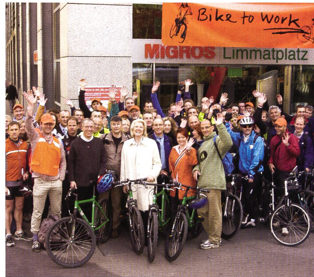
Mitarbeitende der Migros Limmatplatz Zürich und ihre Stahlrösser.

► Weitere Informationen unter: www.biketowork.ch .