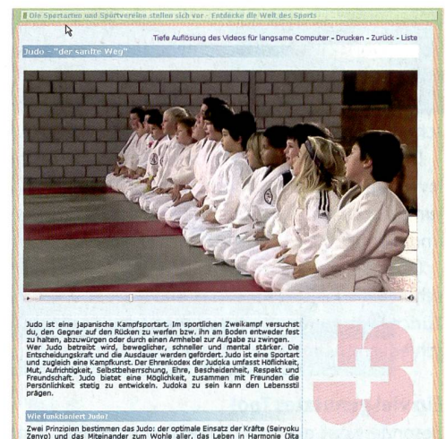
Abbildung 2: Professionelle Clips und Texte motivieren die Jugendlichen, die dargestellten sportlichen Aktivitäten zu testen.