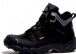
SPEED BUGrip® Active