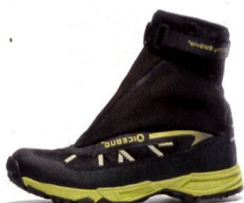
GG FLY BUGrip® Racing