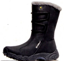
CORTINA BUGrip® Winter