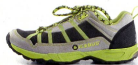
SISU OLX Racing