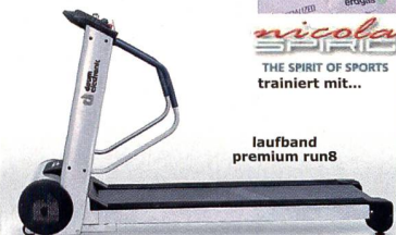
laufband premium run8