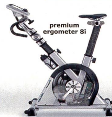
premium ergometer 8i