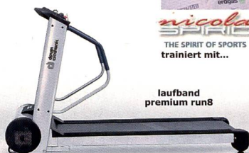
laufband premium run8