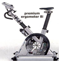
premium ergometer 8i