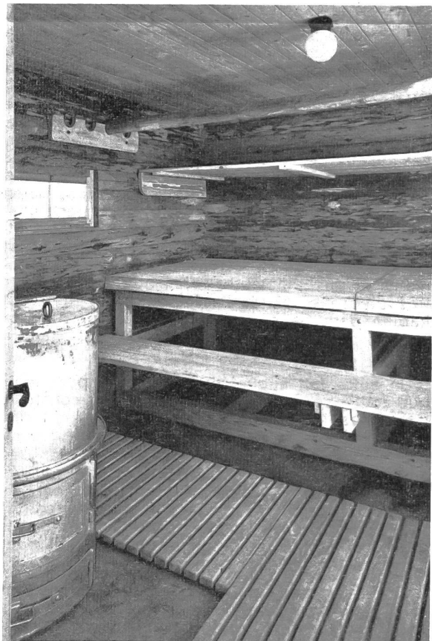
L'intérieur accueillant de la Sauna de Macolin

et tu transpires à un point inexprimable. Et c'est alors que tu sens un extraordinaire bien-être t'envahir ; l'euphorie la plus parfaite ; comme si tu sentais la fatigue te fuir par tous les pores de la peau. Après une demi-heure de ce régime, tu sau-