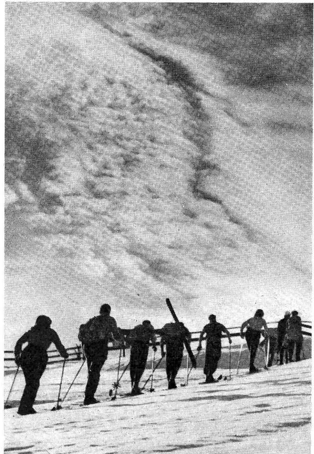
Quand viendra la neige...

physique de nos enfants, manquent en général de compétence, de largeur de vue, de temps ou de moyen d'assurer leur rôle.