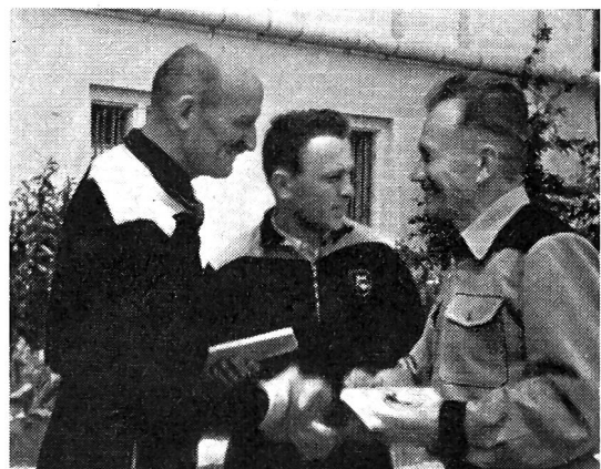
La chaude poignée de main du „ patron ” après le bref stage à Macolin !