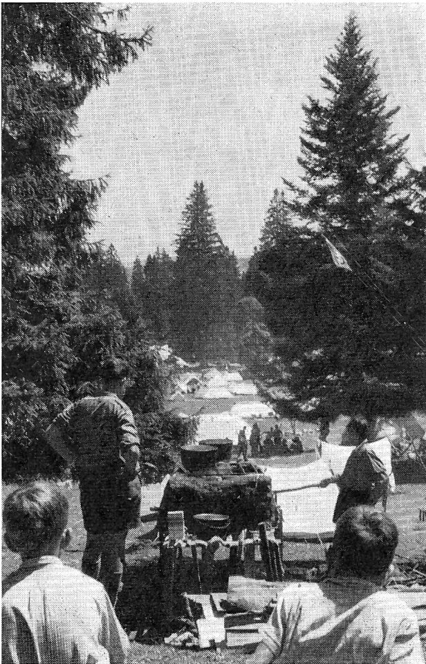
Vue partielle du camp de Gruère: une atmosphère 100% scout!

chaîne de M. le conseiller fédéral et de Madame Chaudet ainsi que de nombreuses délégations civiles et sportives ne parvinrent même pas à troubler!