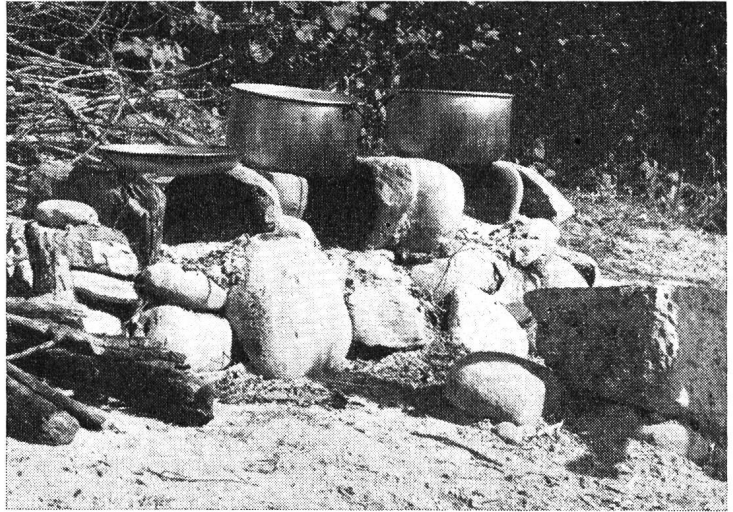
L'âme du camp pour les épicuriens !

«Vous n'avez pas terminé votre campement tant que vous n'avez pas remercié Dieu pour le plaisir que vous y avez eu.» Baden Powell.