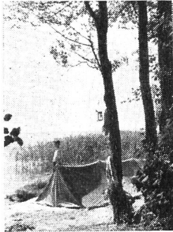
Au bord de l'eau

Utiliser le matériel trouvé sur place pour construire le matelas : fines branches de sapin, mousse, lichens - paille ou herbe recouverte d'une bâche, etc.