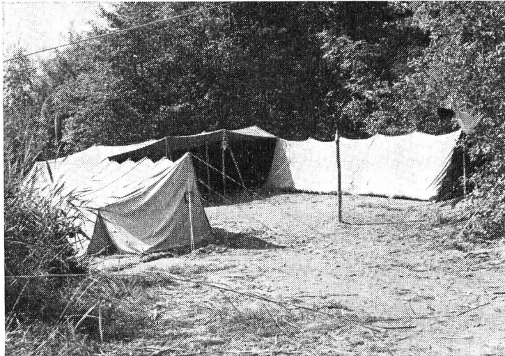
Vue générale du camp

A quoi bon, au fond ? N'est-on pas mieux à la maison ? A l'abri de la pluie et du vent ? Ou faisons-nous du camping pour économiser de l'argent pendant les vacances ?