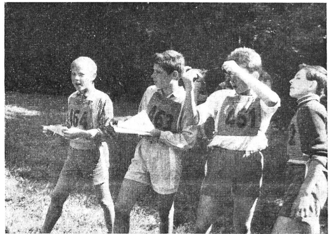
Les « chenillards » du Gr. E. P. Dombresson sont tout à leur affaire.

Cette année, les organisateurs — la commission cantonale E. P. — avaient imaginé toute une série de difficultés nouvelles. C'est ainsi qu'à un poste, les concurrents se trouvèrent devant des photographies aériennes de la région. Ils devaient alors relever sur leurs cartes, un point indiqué sur la photographie. Ailleurs, ils