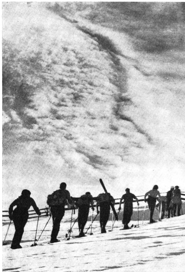
La lente et bienfaisante montée vers les hauteurs, vers le camp.