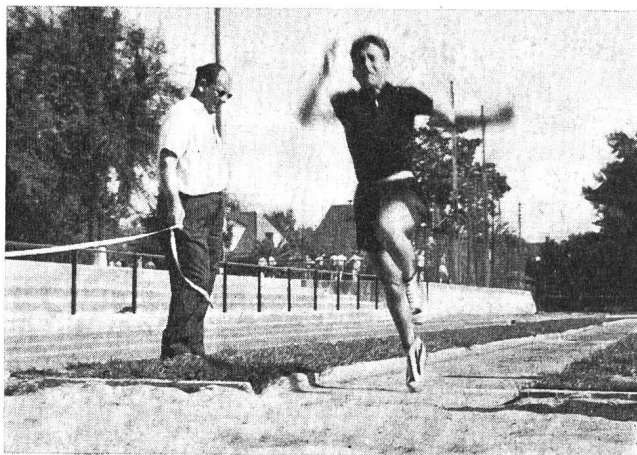
Monsieur Murier fut un expert très intéressé et actif si l'on en juge par ce document.