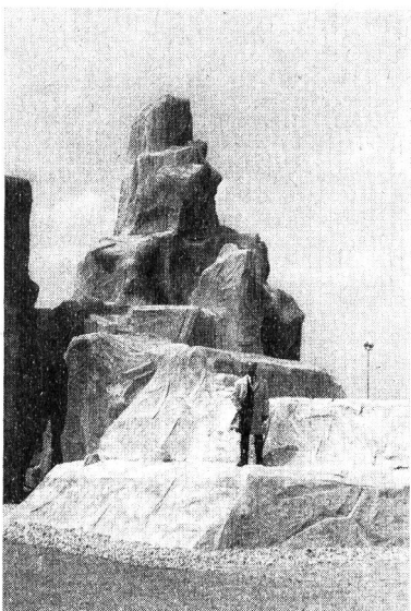
Le rocher de varappe en ciment : école d'alpinisme