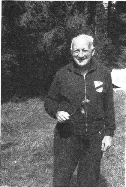
M. le Prof. Karl Diem, le souriant initiateur et réalisateur de l'Académie olympique se régale d'un délicieux bifteck rôti sur braises.