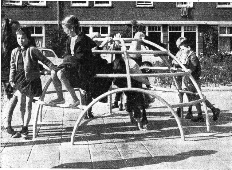
L'hémisphère à grimper est fort apprécié

« voituriers » attachaient leurs chevaux. Entre temps, ces « barres fixes » étaient utilisées, avec ardeur, comme agrès de gymnastique, par tous les enfants du quartier ! L'aspect des cours d'auberges s'est complètement modifié avec la motorisation si bien qu'elles ne sont plus actuellement que des places de parc à automobiles dans lesquelles les enfants n'ont plus rien à chercher. Ce petit exemple — un parmi bien d'autres — nous montre clairement la nécessité qu'il y a de doter nos enfants de places de jeux et d'agrès sur lesquels ils puissent s'ébattre, mesurer leurs forces et stimuler leur sens de la découverte. Les balançoires, glissoires ou autres agrès analogues sont des agrès qui incitent à une activité « passive » et sont, par conséquent, à déconseiller. Ils ont, peut-être, encore leur raison d'être sur une place de jeu pour tout petits, mais plus sur les emplacements destinés à la jeunesse scolaire.