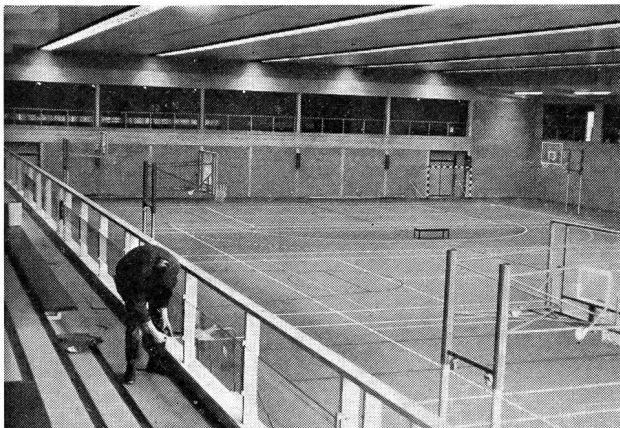
Université de Louvain. Nouvelle salle de sport avec un revêtement en tartan. Contenance 600 spectateurs. Les panneaux de basketball peuvent disparaître dans le sol.

Les différentes visites organisées ont été judicieusement choisies: le traditionnel tour de ville, court et bien dirigé; la visite de l'Université de Louvain, 25 000 étudiants, avec comme principale attraction, la nouvelle salle de sport (60 x 30 m.), revêtement en tartan, qui peut facilement se transformer en 3 terrains de volleyball, de basket ou en terrain d'athlétisme en manoeuvrant des boutons de commande qui font surgir automatiquement du sol les panneaux de basket, la fosse à sable, etc.