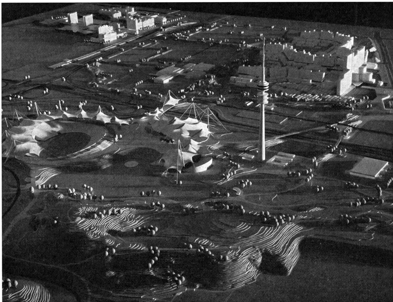
L'Oberwiesenfeld lorsqu'il sera terminé: — au fond à droite: le village olympique; — A droite: la Tour Olympique;