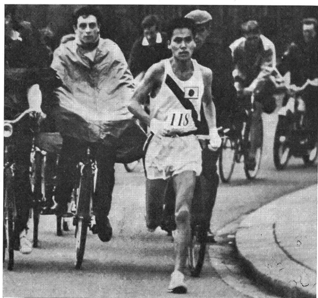
C'était en juin 1965 sur le parcours Windsor-Chiswick. Le Japonais Morio Shigematsu allait terminer vainqueur en 2 h. 12' 00", meilleure performance mondiale à l'époque.

Il est très vraisemblable que l'un des facteurs les plus importants de l'énorme intérêt manifesté par le Japon est de nature physiologique. Avant la première guerre mondiale, la taille moyenne du Japonais était de 160 à 165 cm.; et le Japonais moyen se sentait tout naturellement doué pour ce sport susceptible de le mettre en évidence dans des compétitions internationales. Il pensait en effet qu'un succès en marathon n'était pas forcément fonction de la taille du coureur. La présence d'un Japonais dans un grand marathon fut signalée pour la première fois en 1912, aux Jeux olympiques de Stockholm. Mais ni à cette occasion-là, ni huit ans plus tard il n'y eut de quoi stimuler tout particulièrement les Japonais. Il fallut attendre pour cela 1928, ou le premier succès international; cette année-là, Yamada et Tsuda prirent les quatrième et sixième places du marathon olympique. Dès lors, on allait toujours retrouver des coureurs japonais parmi les dix premiers, sinon même les cinq premiers, du marathon des Jeux olympiques. Après la seconde guerre mondiale, les habitudes de vie des Japonais changèrent considérablement. Il se trouva notamment que