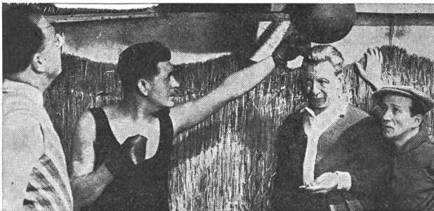
«Un soir de Rafle». Louis Georget (Albert Préjean) s'entraîne sous la direction de Charley Stick (Constant Rémy), admiré par le baron des Haudriettes (Lucien Baroux) à gauche.

Voilà, en vérité, un scénario bien conventionnel, mais à cette époque, le sentimentalisme était nettement plus puissant qu'aujourd'hui. Les metteurs en scène n'avaient pas pour principale motivation cet anticonformisme auquel, désormais, nous devons tant de films ineptes. Ils s'adressaient au peuple et non à de pseudo-initiés. On s'émouvait pour des histoires simples, et même banales; en tout cas fort proches de la vie: populistes, en un mot, ce populisme qui devait tout de même subjuguier des romanciers tels que Jean Prévost, Henri Troyat, Paul Vialar et Louis Guilloux. Aucun excès d'aucune sorte; aucun parti-pris de singularité. Après la projection, les spectateurs pouvaient rentrer chez eux rassérénés: certes, ils vivaient dans un monde difficile, mais au moins trois choses ne pouvaient qu'emporter l'adhésion des vieux et des jeunes: l'amour, l'amitié, et, cernant tout cela, une solidarité bien robuste. De tels sentiments triomphaient de toutes les avanies de l'existence! Même dans les films sportifs, où la raison du plus fort n'était pas toujours la meilleure si l'amour n'intervenait pas!