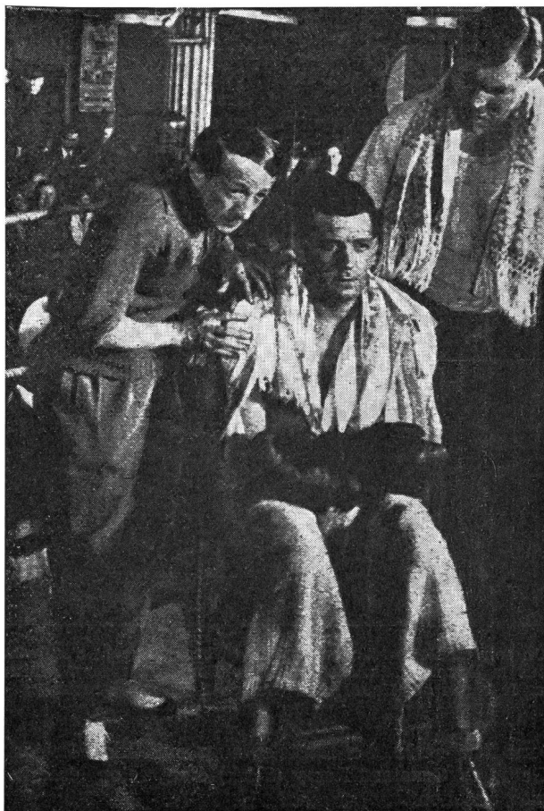
«Un soir de Rafle»: un bon film!

Dans ses mémoires, Georges Carpentier évoque ce film en ces termes: C'est l'histoire d'un ancien champion de boxe tombé dans la débîne, qui «remet ça», se fait battre, et que la fille qu'il aime abandonne pour un imprésario douteux. Un scénario qui n'était pas d'une originalité bouleversante, mais valait par les détails.