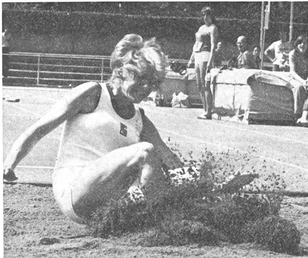
Il suffit d'une championne...

Le principal n'est-il pas de reconnaître le droit de tout un chacun au bonheur et à la santé? Mais le chemin des uns n'est pas nécessairement le chemin des autres. Ce qui compte, c'est le but à atteindre et la certitude d'y arriver. Le succès est une preuve de «justesse» et un cri de «justice!» Et je poursuivais en relevant l'aversion du public et des «spécialistes» pour l'athlétisme féminin, aversion motivée, il faut bien le reconnaître, par certaines «apparitions» peu flatteuses! »Dès lors, les filles athlètes, persévérantes et entêtées, devaient se munir plus que jamais d'un double courage avant de fouler la cendrée: celui qu'il faut pour débiter une «épreuve» et celui qu'il leur fallait pour affronter la foule hostile.