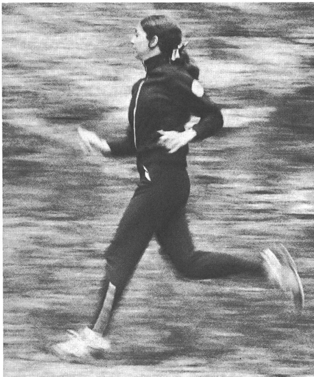
Kathy Switzer: «Quand je cours, je me sens vivre!»

Pour terminer ce paragraphe, j'aimerais citer un mot de Valéry: «Deux maux menacent le monde, écrit-il, l'ordre et le désordre. L'ordre parce qu'il endort les consciences et exclut le progrès: le désordre parce qu'il empêche toute décision et mine les espérances. Pour que la participation échappe à ce cercle vicieux, il faut l'organiser avec une même volonté d'aboutir.»