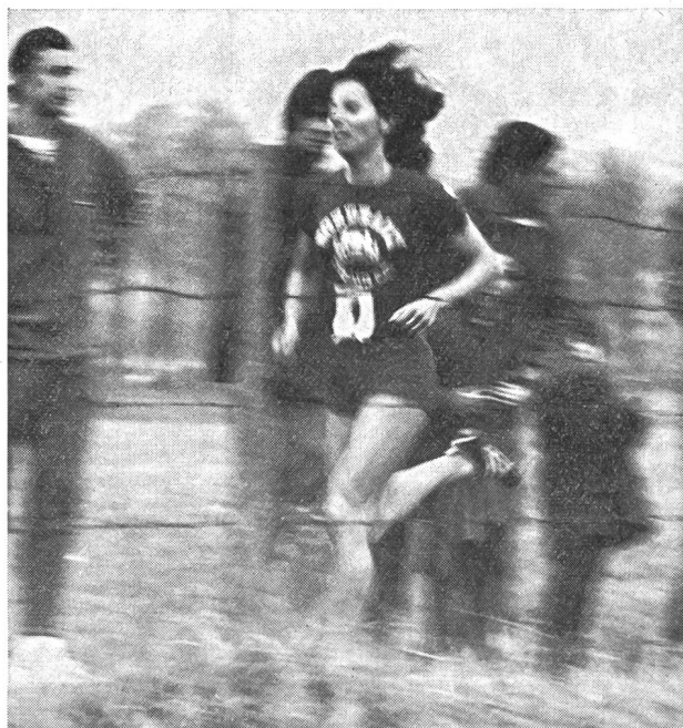
...«Je suis championne olympique du 400 m, mais je préfère les longues distances!...»