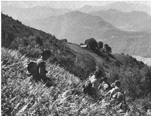
Découvrir le moyen d'utiliser le temps libre de façon à être plus heureux!