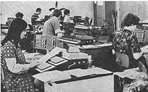
Un face à face impressionnant: l'homme et la machine.

«On a pu réussir à prendre pied sur la lune, à parcourir près de 300 000 km en moins d'une semaine à travers l'espace... mais en même temps, il est impossible d'arrêter la guerre entre deux peuples. Pourtant, poursuit Fourastié, les sciences humaines, les sciences sociales sont les plus importantes pour l'homme, en particulier la connaissance de ses activités, celles du travail, celles du loisir.»