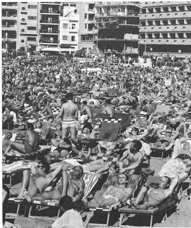
La masse, qui se voit offertes brutalement toutes les possibilités de satisfaire ses caprices, se précipite avec frénésie et sans distinction vers ce qu'elle croit être «son loisir» et «sa liberté».

Le délasserment aboutissant fréquemment à la paresse et à l'oisiveté, le divertissement étant presque toujours lié à l'absorption de produits néfastes à la santé (alcool, tabac, stupéfiants), et le développement culturel exigeant rarement de sortir de l'immobilisme, on se rend facilement compte que l'homme de la «civilisation des loisirs» est un être menacé dans son essence