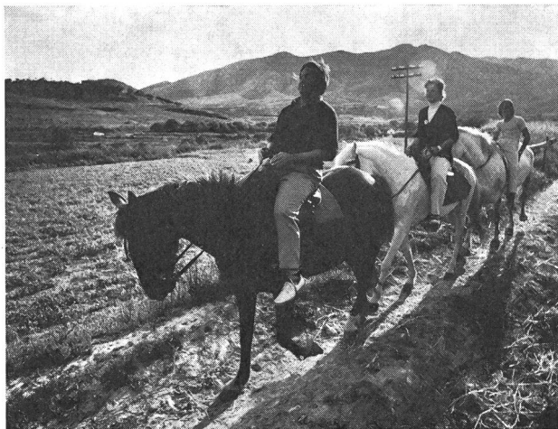
Echapper au conditionnement publicitaire pour retrouver la joie de vivre !

Pour assurer cette réussite, ceux qui s'intéressent à la promotion de l'homme en tant qu'être humain sont tous investis d'une part de responsabilité et peuvent