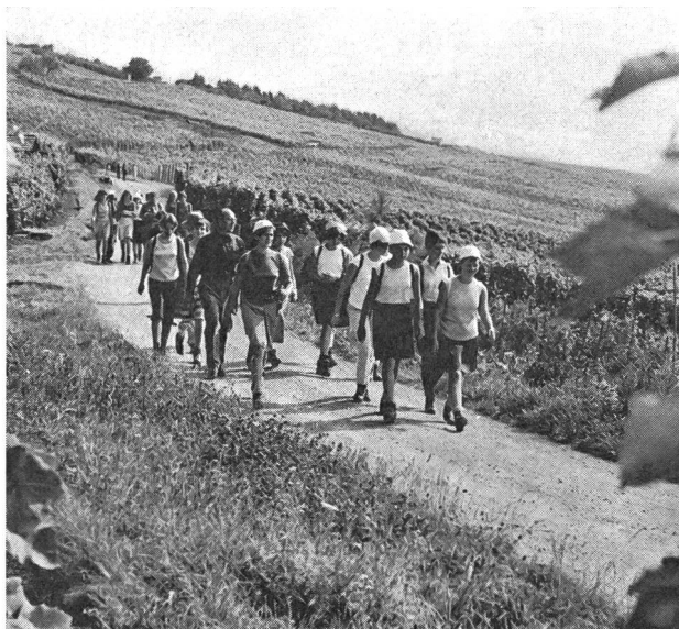
Redonner l'amour de la nature et de l'effort.