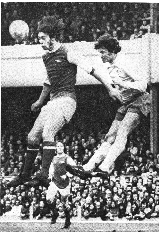
Duel de la tête lors d'un match du championnat anglais: Arsenal - Derby County.

Le travail musculaire et par conséquent la force est à la base de toute activité physique. La bonne exécution d'un mouvement ou d'une suite de différents mouvements dépend en partie de la force disponible. Ce facteur force représente une des bases essentielles de la qualité des différents mouvements propres au football. La force proverbiale du football anglais, dont dépend par exemple la bonne qualité du jeu de tête (cf. photo) ou des longues passes, est concevable en Angleterre parce que la force est entraînée systématiquement chez les jeunes footballeurs.