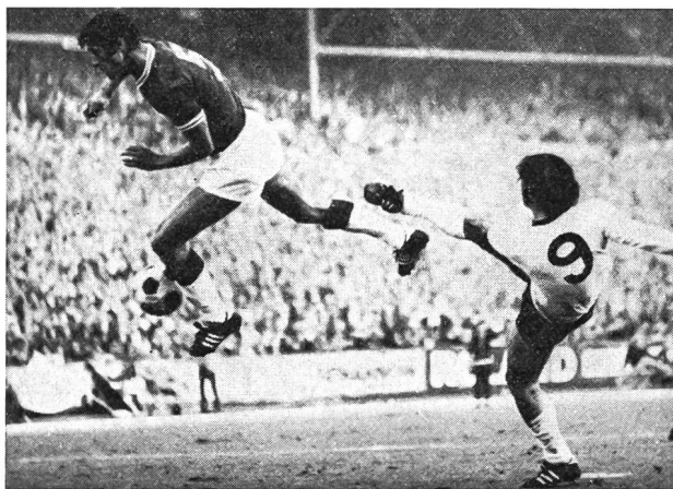
Allemagne - Turquie. Reprise directe en rotation de Gerd Müller.

Lors des dribbles, du coup de tête, de la remise en jeu, du tir en rotation (cf. photo de G. Müller) ainsi que lors de la passe et du tir de façon générale, la force du torse est à la base d'une exécution correcte et puissante du mouvement. La force de la musculature du torse joue un grand rôle dans la condition physique lors des courses, des sauts, des changements de direction et des feintes de corps.