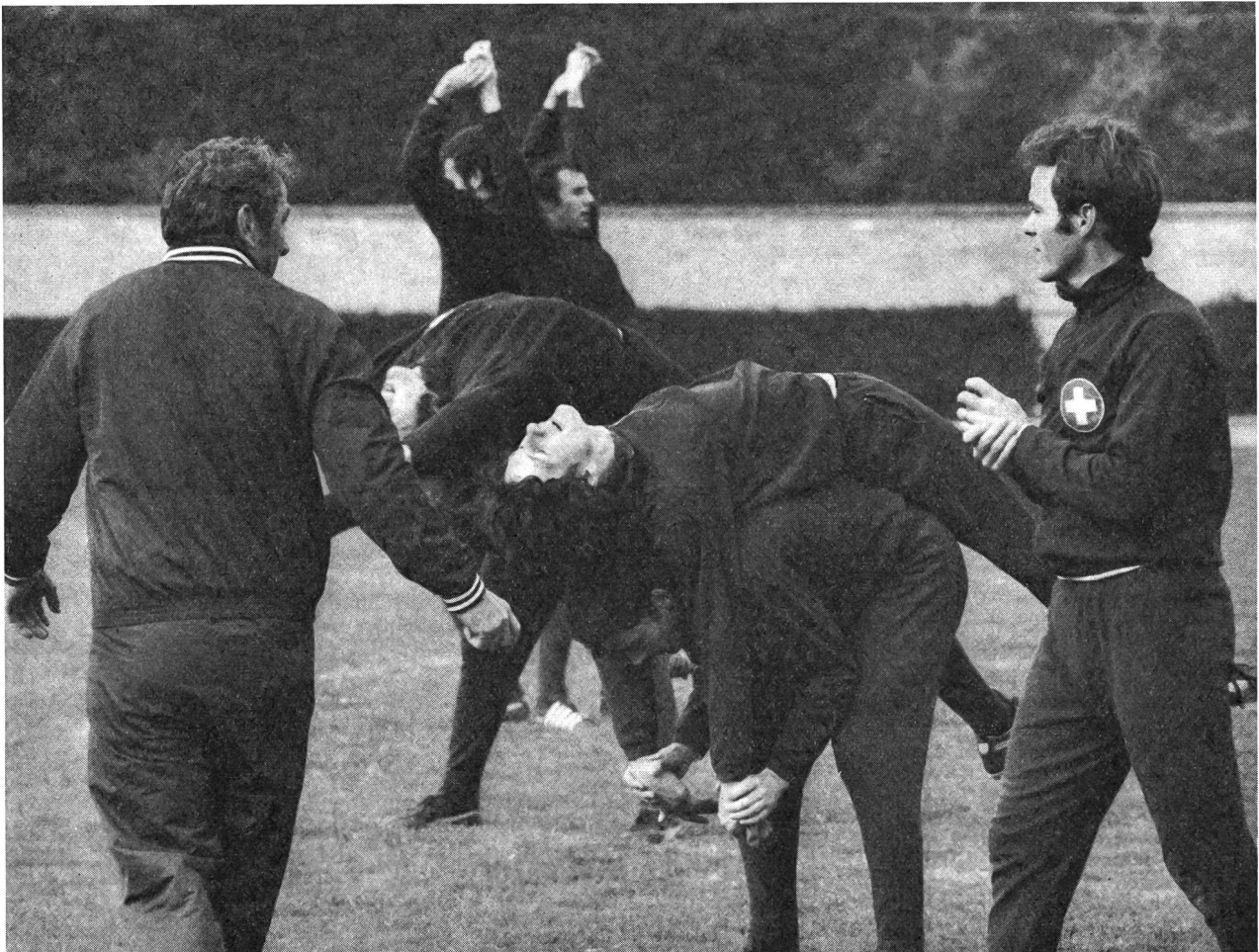
Joueurs de pointe suisse «au travail».

La musculation complémentaire, organisée sous forme jouée se prête avant tout au développement de la musculature du torse et des bras. Cette force est nécessaire dans le jeu, mais n'est que très peu développée par la compétition. L'entraîneur doit donc, sous forme complémentaire à l'aide de jeux de combat, d'estafettes, d'exercices avec partenaires ou de ballons lourds etc., donner aux joueurs la bagage nécessaire à la réussite dans le jeu.