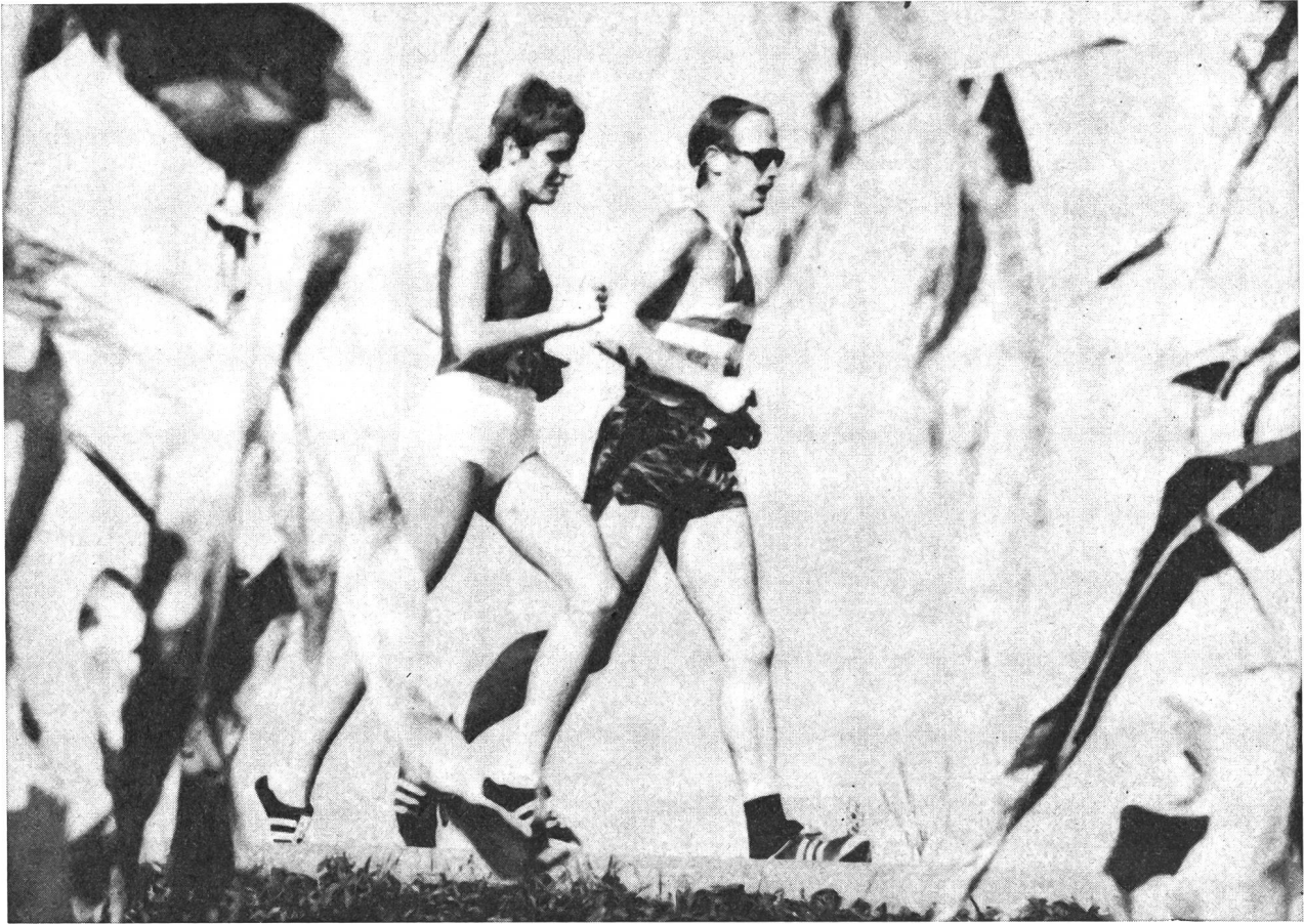
Cette photo n'est pas du marathon de Boston, mais elle illustre bien la beauté de la course «pour elle et pour lui»!