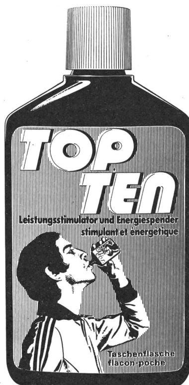
Abbildung/Figure 3 Originalpackung von Top-Ten. Emballage original du Top-Ten.

et sera vendu dans les magasins spécialisés (fig. 3). * Top-Ten sera livré, prêt à la consommation, dans des flacons incassables avec bouchon dévissable que l'on peut facilement emmener avec soi, même en tenue de sport très légère. Un flacon de 150 ml de liquide contient 90 g d'hydrates de carbone de haute