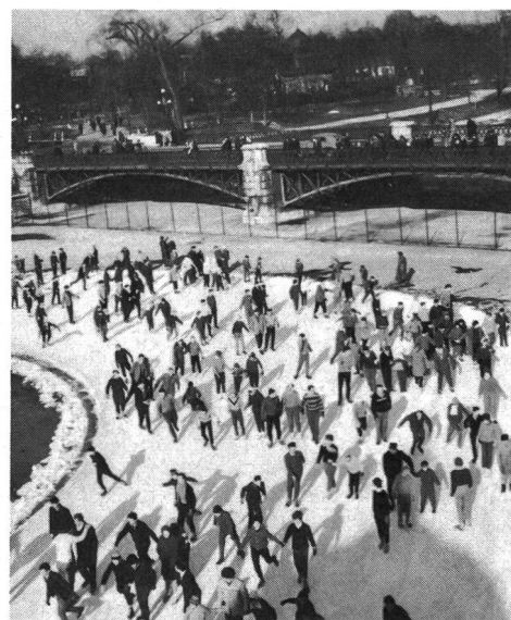
La patinoire dans le parc de Budapest

e) La Centrale de propagande pour le sport