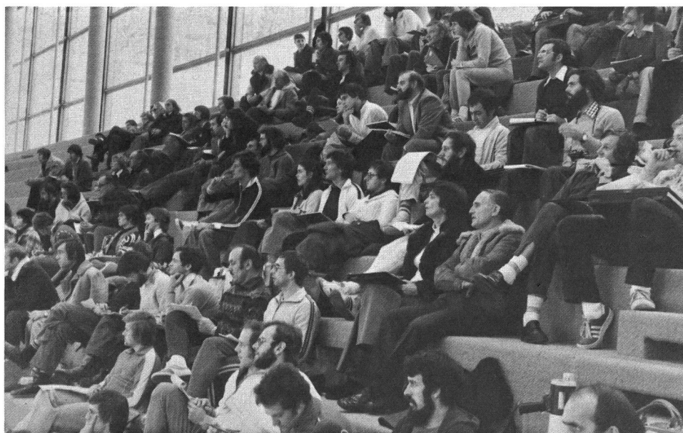
Une partie de nos moniteurs durant une démonstration de la classe d'application

Mais de temps à autre on peut voir également du volleyball pratiqué comme sport populaire. Les journaux, eux, écrivent beaucoup sur le volleyball. Il y a même des articles dans le «Neues Deutschland» (nouvelle Allemagne) et l'on a essayé, par des séries d'articles, d'expliquer aux lecteurs les règles et l'idée du volleyball.