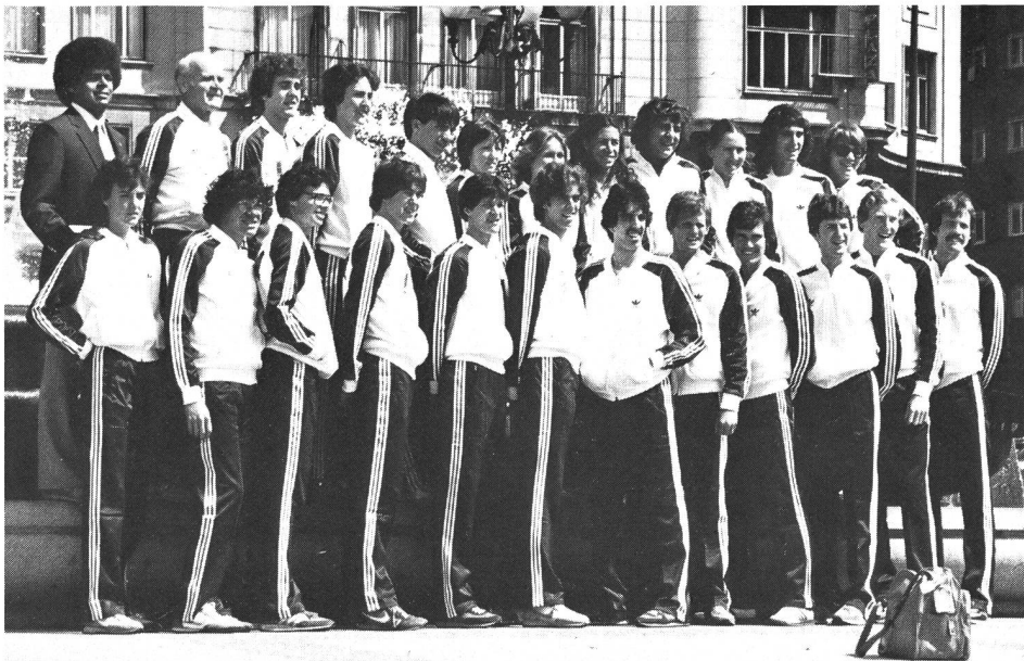
L'équipe américaine: Virgin, premier, n'y trouve sa valeur que par le résultat de Malley, cinquante et unième!