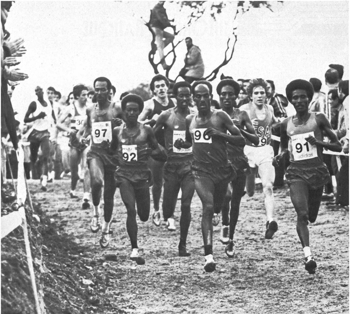
Les Ethiopiens se retrouvent bientôt tous autour de leur chef: ils luttent ensemble. Par la suite, ils vont sprinter un tour trop tôt. Ils vont alors partiellement disparaître dans l'anonymat du peloton: ils ne se verront plus, ils ne se «sentiront» plus, mais ils continueront à se battre dans l'ombre pour le résultat d'ensemble. Ils remporteront ainsi malgré tout le titre par équipes.