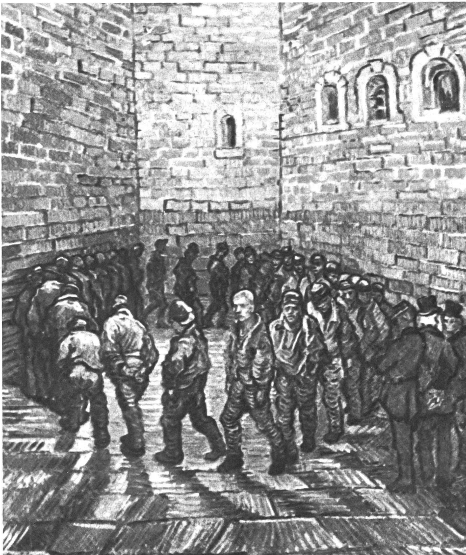
Dans la cour d'une prison

C'est parce qu'elle est consciente du rôle primordial que le sport a à jouer auprès des prisonniers que la FCSGS a entrepris cette action, une action qui va se poursuivre et qui devrait bientôt porter des fruits.