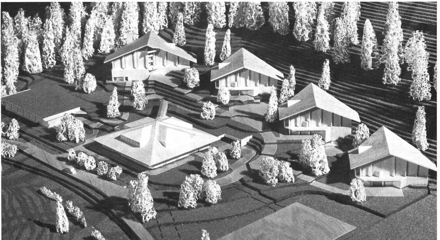
Centre de cours (ski) de l'EFGS, à la Lenk

Ce changement est d'une importance capitale. Il laisse espérer que le sport pourra être mieux intégré dans notre société et qu'il deviendra un élément réel de notre culture malgré les dangers qui l'entourent. Le sport donne à chacun sa chance. Pour une fois, c'est lui qui en a besoin. ■