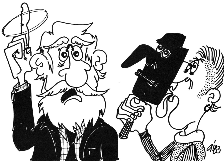
Une conversation, un dialogue naît entre le «tu» et le «je», et non pas entre des groupes. La conversation qui s'établit débouche alors sur le «nous».

gences, ils peuvent s'accepter, la voie est ouverte à un dialogue fructueux. Deux êtres aux idées différentes qui discutent ou se disputent ne parlent pas du même