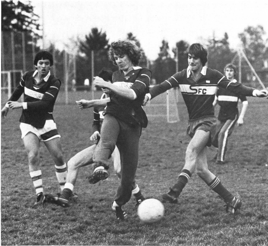
Situation de jeu collectif: «3:3»

Les gains relativement faibles peuvent s'expliquer par le «manque d'occasions», qu'ont ceux qui apprennent, d'être engagés en situations d'apprentissage proprement dites.