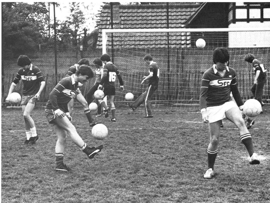
Habilités individuelles: «la touche de la balle»

Selon nous, les techniques de supervision, que nous connaissons actuellement en football ne permettent pas réellement une évaluation systématique. Trop souvent, elles sont empiriques et très peu élaborées, ce qui ne favorise guère un diagnostic précis et constructif, de l'intervention de l'entraîneur. Aussi, les éléments qui font l'objet d'une évaluation ne sont pas toujours suffisamment en relation avec les aspects de l'entraînement qui influencent directement la préparation des joueurs. Finalement, les différents modes d'évaluation ne sont pas assez orientés vers la formation; ils se limitent généralement à des jugements de valeur, émis très souvent en vue d'une qualification de l'entraîneur.