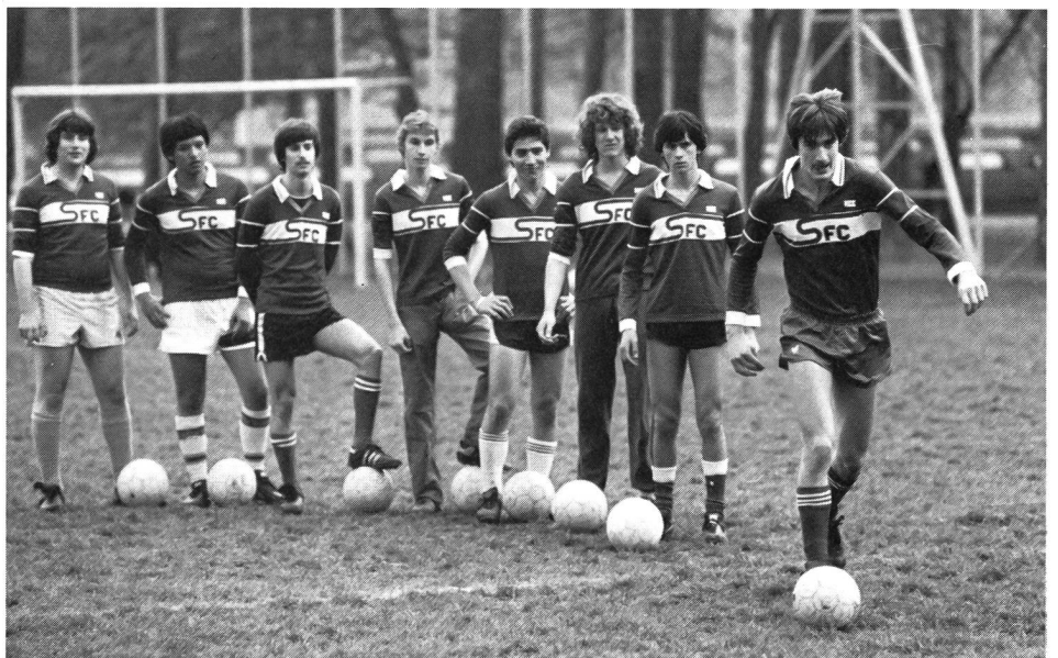
Joueurs non engagés: trop d'attente...