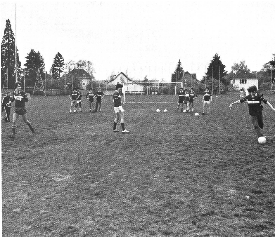
Habiletés technico-tactiques: «le une-deux»