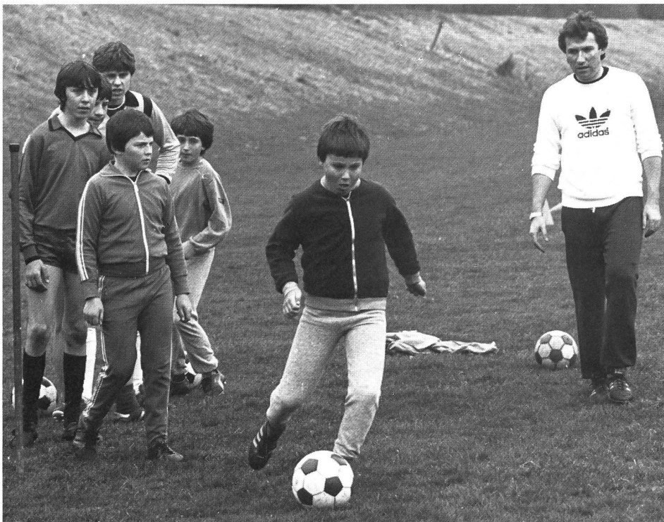
... voué au service de l'homme à travers et par le mouvement, dont le sport est une manifestation majeure!

L'éducation physique présente un éventail si vaste d'objectifs et de moyens d'action qu'aucun enseignement ne saurait les embrasser tous. Le praticien se trouve par conséquent en permanence dans l'obligation de procéder à des choix, et c'est à ce