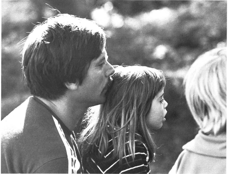
A tout âge, l'enfant est la «matière première» de l'enseignant.

Le champ d'action de ce praticien, c'est l'école, institution mouvante, souvent controversée; l'institution dont on attend le salut de l'individu et de la collectivité; celle qui, la première, est mise en accusation par les mass media et l'opinion publique dès qu'un rouage commence à grincer dans la société; dès que les frasques de la jeunesse deviennent trop gênantes, par exemple; ou dès que les résultats de l'équipe olympique ne répondent plus aux espoirs que la nation plaçait en elle!... Quant à la «matière première» de l'enseignant, c'est la plus précieuse au monde, c'est l'enfant, l'adolescent: un corps merveilleux, son métabolisme, ses admirables capacités motrices; une intelligence éprise de connaissance, avide de compréhension; une âme avec sa sensibilité, ses passions, sa soif de beauté, de créativité. Impossible de dissocier, de traiter partie par partie ce sujet à l'extraordinaire complexité. Toujours et partout, c'est à l'être tout entier que s'adresse l'enseignement.