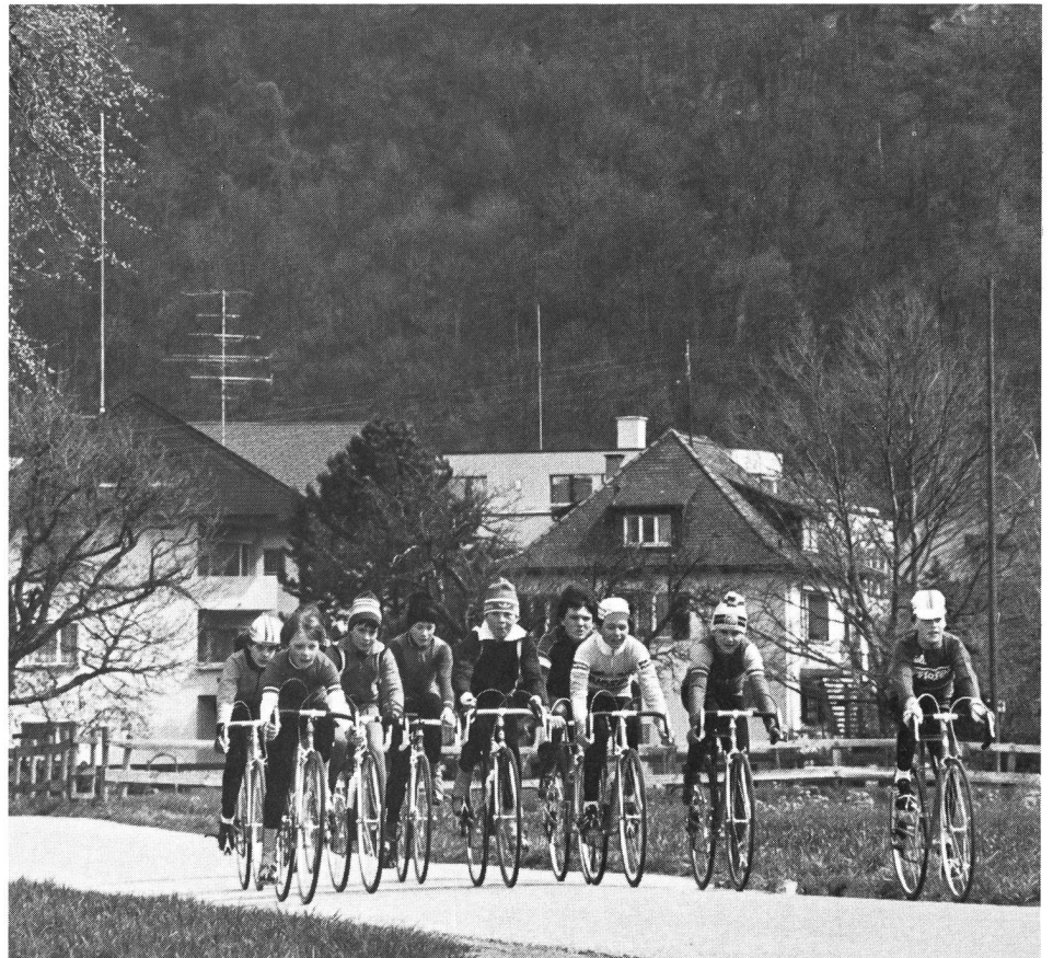
Priorité à la condition physique ou à la technique?

(Texte adapté d'une conférence présentée dans le cadre d'un séminaire international sur l'histoire de la science sportive.) ■