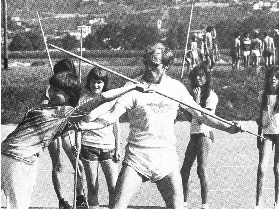
Une partie seulement de l'apprentissage incombe au praticien.

ves de 16 à 17 ans ayant répondu au questionnaire, le 70 pour cent au moins pensent qu'en général «les profs de gym» ne sont pas des gens cultivés, et qu'il n'est vraiment pas indispensable d'avoir de grandes qualités intellectuelles pour embrasser cette profession. A côté de celle-ci, bien d'autres perles encore dans ce mémoire qui nous laisse rêveur. Et pourtant, sous ce rapport, l'opinion a évolué très favorablement au cours des dernières décades. Cette amélioration de la situation est due indiscutablement aux progrès de la connaissance, en particulier dans les sciences humaines. En prouvant l'urgente nécessité de l'exercice physique pour la santé et l'équilibre de l'écolier, en démontrant l'unité fondamentale, indissociable de la personne humaine, en expliquant les mécanismes de l'interaction, de la dynamique du groupe, la science a contribué dans une très large mesure à valoriser l'éducation physique et à lui faire acquérir une plus juste place dans les programmes scolaires. En justifiant, en cautionnant le travail du praticien de tout le poids de son immense prestige, elle l'a rendu plus crédible, plus digne de considération non seulement dans le milieu scolaire, mais aux yeux de toute l'opinion publique. Les jugements des élèves cités dans le mémoire dont nous venons de parler peuvent en toute sérénité être mis au compte d'un manque d'information.