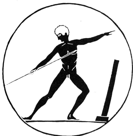
Redonner au Corps sa fonction de tabernacle de l'Esprit.

La complexité de l'être humain, l'influence des multiples facteurs qui conditionnent le déroulement de l'apprentissage font que, dans l'acte pédagogique, les mêmes causes ne produisent pas nécessairement les mêmes effets. De ce fait, à chaque pas, le praticien se trouve confronté à de nouvelles questions: problèmes d'ordre médical, psychologique, relationnel, social, ou simples questions d'ordre technique ou matériel. Sans cesse, il doit se remettre en question, faire une nouvelle appréciation de la situation, modifier son projet, infléchir son action. A ce stade encore, la science intervient pour l'aider à cerner les problèmes, à mieux comprendre les difficultés, à en détecter les causes et à leur trouver la meilleure solution. C'est ainsi qu'après avoir sécurisé l'enseignant dans ses choix, elle contribue à l'efficacité du travail.