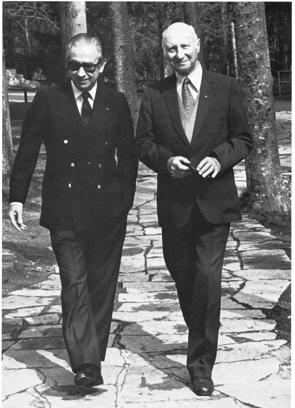
Avec M. Samaranch, s'écrie M. Gafner (à droite), l'olympisme descend dans la rue!

Par notre résolution, nous lançons un vibrant appel à la solidarité dans l'accomplissement, par les hommes et par les femmes à égalité de droits, du mode d'expression le plus simple, le plus universel et le plus efficace qui puisse s'imaginer, mis à la disposition de l'être humain pour le maintien et le développement de sa santé, de son bien-être et de son équilibre général. Très rapidement un esprit, dit «esprit Spiridon» s'est emparé du mouvement en pleine expansion. Les principes dont il s'inspirait boule-