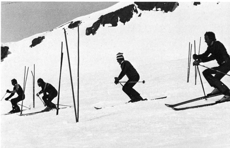
Le slalom parallèle: maîtrise et technique.