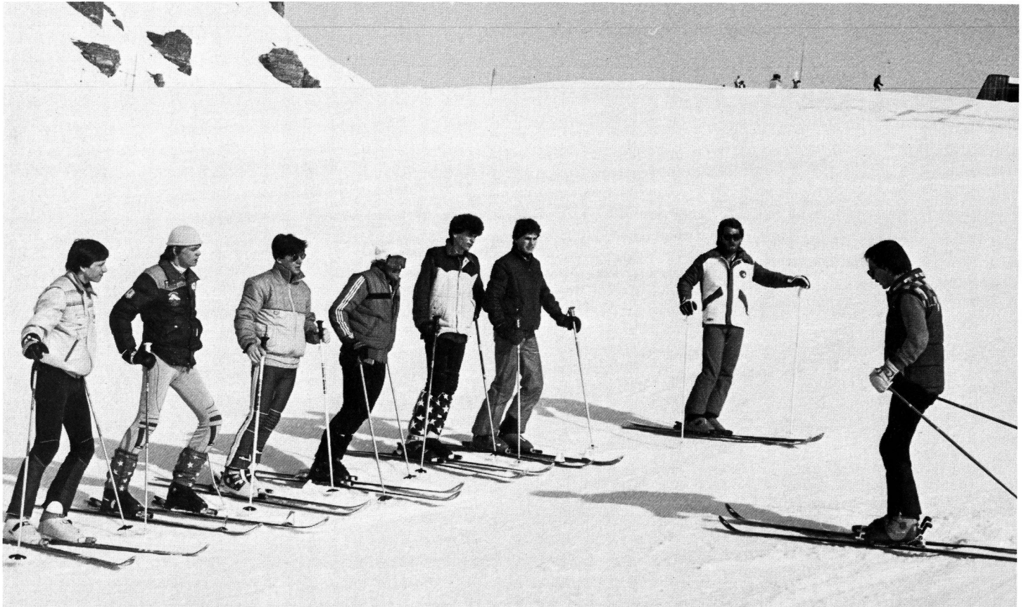
La théorie avant la pratique.

En fait, lors de telles réunions de formation, les enseignants doivent s'efforcer d'apporter – et les candidats moniteurs de recevoir – les éléments fondamentaux, d'ordre aussi bien socio-pédagogique que pratique, qui correspondent à ceux prônés par la « Conception Jeunesse + Sport » et qui sont, pour les premiers, de ne pas oublier qu'ils ont à préparer des meneurs d'hommes (les seconds) capables non seulement d'encadrer, mais d'animer, d'enthousiasmer une jeunesse qui, à l'âge qu'elle a, n'attend qu'un signe de motivation suffisamment convaincant pour se laisser entraîner dans le sillage d'un chef de file. « Le dynamisme de J + S dépend de l'esprit et des qualités de ses moniteurs. » Or, les qualités se cultivent pour mieux éclore et l'esprit s'acquiert et se développe pour mieux se répandre. ■