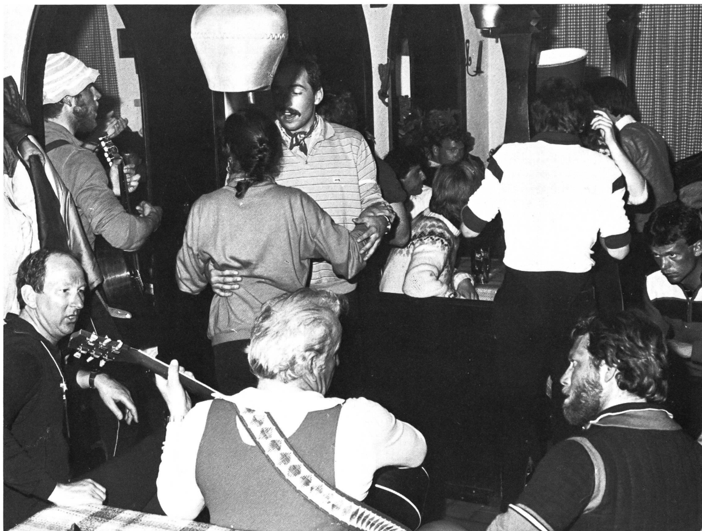
... avant de se délasser un brin.