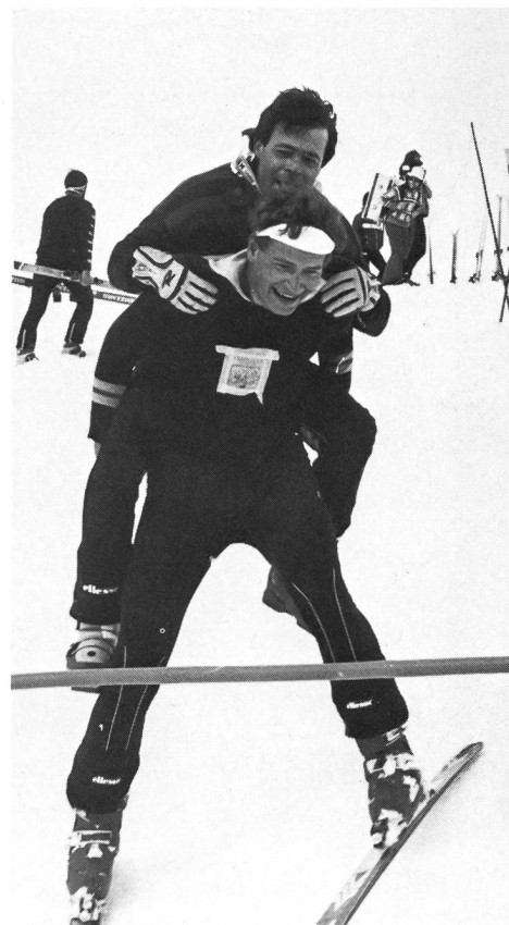
Force, équilibre, jeu!

Etre moniteur 3 c'est bien! Etre un moniteur 3 actif, c'est mieux!