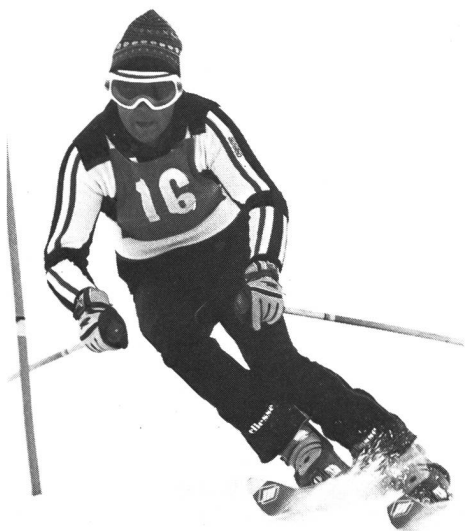
Un petit concours...

Jusqu'à présent, le cours central J+S a toujours été organisé dans le cadre de celui de l'Interassociation suisse pour le ski. En raison de l'ampleur prise par cette réunion de travail et parce que les objectifs des deux parties ne sont pas toujours les mêmes, on a décidé de les séparer. Dès cette année, le CCF suivra immédiatement le CC de l'IASS. Il rassemblera les formateurs et experts chargés de l'enseignement et de la direction des cours centraux régionaux. ■