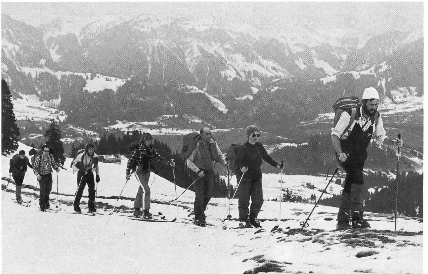
Pour eux aussi, l'hiver a commencé.