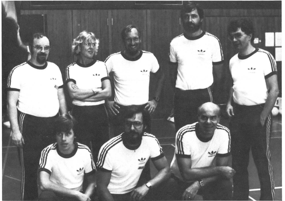
Des organisateurs satisfaits.