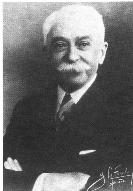
De Coubertin misogyne?

Le baron Pierre de Coubertin, rénovateur des Jeux olympiques de l'ère moderne, n'était pas du tout favorable à la participation féminine au grand rendez-vous quadriennal. Il le répéta à de nombreuses reprises et, en particulier lors d'un discours prononcé à la radio suisse romande à l'occasion des Jeux olympiques de Berlin, mais bien avant déjà. En 1921, dans ses «Leçons de pédagogie sportive» par exemple, on peut lire ce qui suit: «... La question des sports féminins s'embrouille de ce que la campagne féministe y apporte de passion et d'expression exagérées... C'est ainsi qu'en sport, les femmes font appel