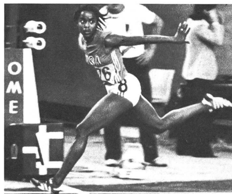
Evelyne Ashford, beauté féminine aux Jeux olympiques (ici à Montréal).

Notre seul but ici est, pour des raisons impérieuses de calendrier et d'horaire, de réserver le programme olympique uniquement aux épreuves masculines ou, pour mieux dire, à des épreuves mixtes: hommes et femmes».