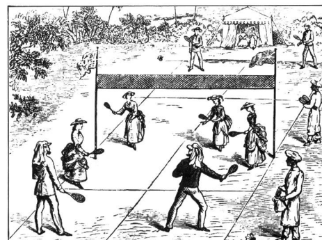
En 1878 aux Indes.

A l'encontre d'autres sports (tennis ou squash), le badminton s'apprend vite. Après peu de temps déjà, on parvient à jouer agréablement. En outre, il sollicite fortement la condition physique. Il peut être pratiqué par tous, hommes et fem-