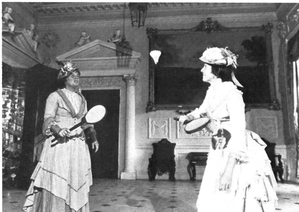
Deux dames expérimentent le « volant » à Badminton House.