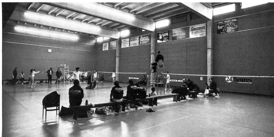
Le plus difficile est de disposer d'une salle adéquate.

Tout comme le volleyball, le badminton est aussi bien un jeu de plage qu'un sport de haute compétition. Les raquettes et le volant font souvent partie intégrante du matériel de camping, du panier de pique-nique ou des affaires de plage. Il suffit de tendre une corde entre deux arbres ou entre deux poteaux, de déterminer les dimensions d'un terrain et le tour est joué. Les échanges peuvent commencer. L'équipement nécessaire au « jeu du volant » et au badminton ne diffère que très peu. Le volant en plastique est remplacé par un volant à plumes, la raquette en bois, un peu lourde, par une raquette métallique plus légère. Par contre, le but des deux formes d'activité diverge nettement. Au « volant », on essaie de jouer avec le plus de précision possible et de réussir un nombre élevé d'échanges. Au badminton, on tente au contraire de « placer » le volant de telle sorte que l'adversaire ait un maximum de peine à le reprendre. La pratique du badminton permet de faire de rapides progrès.