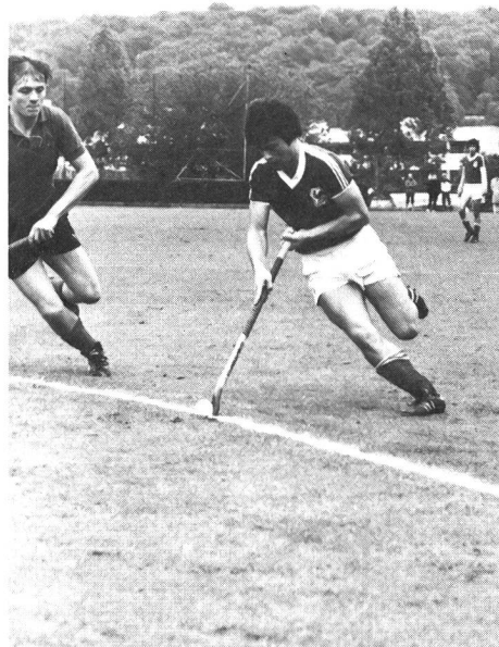
Passe de revers en pleine course.

en revers, il suffit de la pousser à l'aide du corbin, du pied gauche au pied droit, par rotation du haut du corps et par déplacement simultané du pied gauche en avant, le pied droit recevant le poids du corps au moment où la balle quitte le corbin pour aller vers le partenaire.