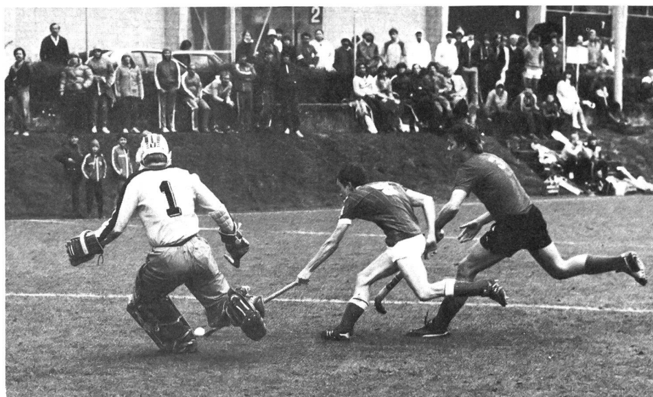
Application parfaite de la technique pour la conquête de la balle.

par un attaquant). Le joueur doit, après deux ou trois pas rapides, se détendre brusquement en portant tout le poids de son corps sur la jambe gauche fléchie et en lançant en avant la crosse tenue à bout de bras par la main gauche (mouvement du faucheur). Attention à viser la balle et non la crosse ou le tibia de l'adversaire!